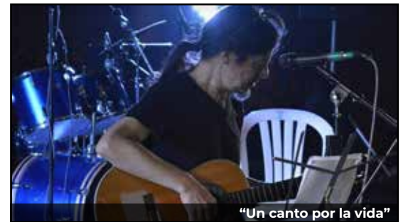
"Un canto por la vida"

Realmente, ha sido impactante, retomar la historia de las Peñas de Integración cultural en este territorio del sur de Bogotá y su trascendencia para los amigos de las artes.