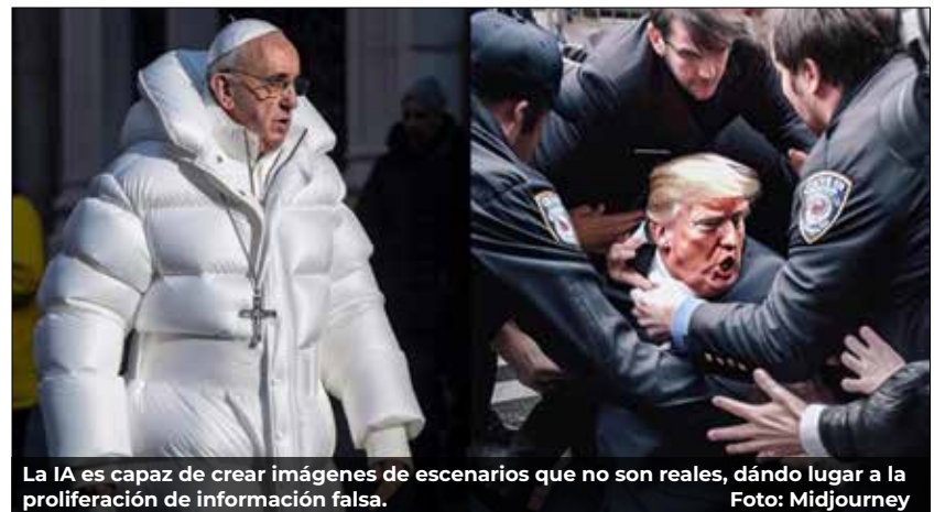
La IA es capaz de crear imágenes de escenarios que no son reales, dando lugar a la proliferación de información falsa.