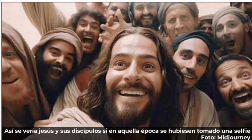
Así se vería Jesús y sus discípulos si en aquella época se hubiesen tomado una selfie.

No hay que mirar muy lejos para ser conscientes de la intromisión de la sinteticidad, en YouTube, una plataforma dedicada al consumo de videos cada vez es más común observar cómo -sin importar- el canal o el contenido que se esté viendo, que siempre hay unas voces de mujeres y hombres que resultan ser muy parecidas entre ellas, he ahí a la IA, y no solo se trata de la voz; los guiones (lo que se dice en el video) e incluso la edición (las imágenes y clips que acompañan a la voz) todo está automatizado por inteligencias artificiales, es decir que no solo está reemplazando nuestros trabajos, también nos está educando, nos está entreteniéndolo. En un futuro no muy lejano realizará las compras por nosotros, por qué sabrá que queremos comer sin nosotros aún haberlo decidido, también leerá a nuestros hijos los tradicionales cuentos para dormir, inventados por ella misma.