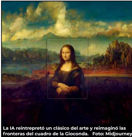
La IA reinterpretó un clásico del arte y reimaginó las fronteras del cuadro de la Gioconda.

Las invenciones del mundo actual tienen la capacidad de propagarse a una velocidad cada vez mayor: el internet en la segunda mitad del siglo xx, la aparición de los dispositivos móviles inteligentes en 2007 o el 5G que continúa su expansión por todo el mundo, sin embargo, ninguna innovación tecnológica ha sido tan rápidamente adoptada por la humanidad como lo está siendo la de la inteligencia artificial. En 2017 -hace tan solo un puñado de años- fueron publicados los primeros papers (artículos científicos) por la empresa de tecnología Google, en dónde se anunciaban avances significativos en los campos de la computación, concretamente se habló sobre el potencial