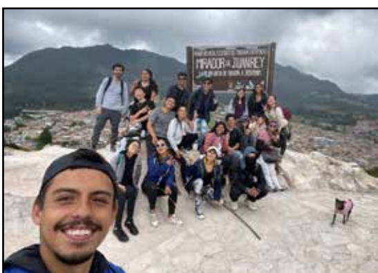
Por: Santiago Rodríguez Baquero Estudiante Universidad Distrital Francisco José de Caldas